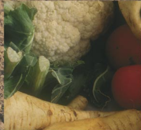
240 kg de hortalizas

Ejemplos del volumen de la cosecha de un campo de 10x10 m, en función de su uso.