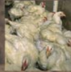
20 kg de pollo