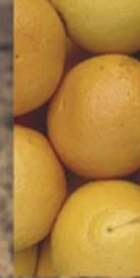
40 kg de frutas